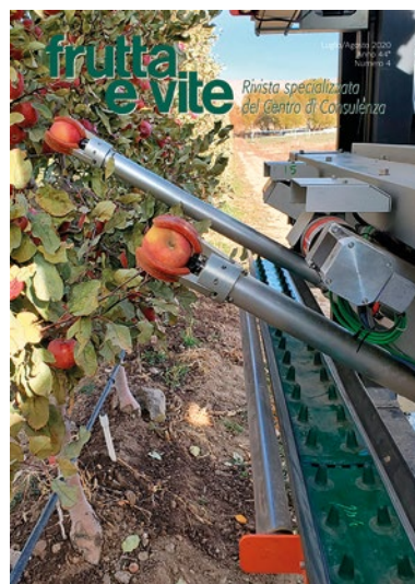
Robot: i futuri raccoglitori di mele?